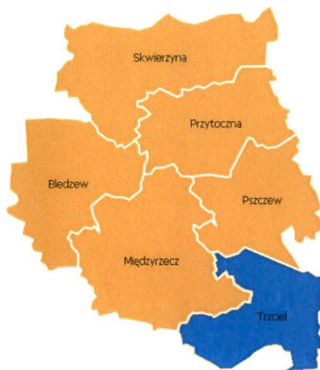
Rysunek 1. Gmina Trzciel w powiecie międzyrzeckim

Gmina Trzciel zajmuje obszar 178 km 2 . Według danych GUS z końca 2016 roku Gmina liczy 6.545 mieszkańców, a gęstość zaludnienia to w przybliżeniu 37 osób/km 2 . Gmina Trzciel leży w południowej części powiatu międzyrzeckiego w odległości ok. 25 km od siedziby władz powiatu - Międzyrzecza. Bezpośrednio graniczy z następującymi jednostkami: Miedzichowo, Międzyrzecz, Pszczew, Szczaniec, Świebodzin, Zbąszynek, Zbąszyń.