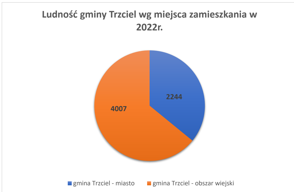
Wykres 1. Ludność gminy Trzciel według miejsca zamieszkania